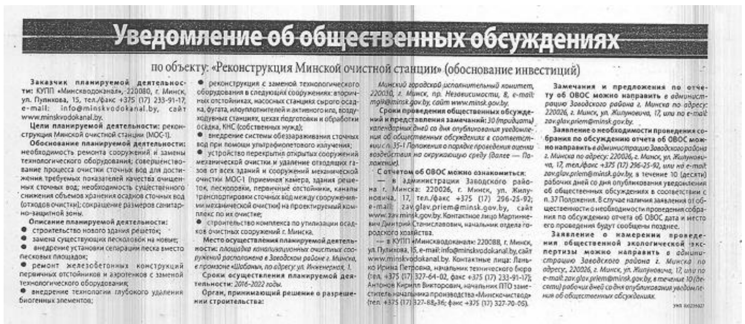
Рисунок 4.1 Объявление в газете «Минский курьер» о проведении общественных консультаций

В ноябре 2015 года УП «Минскводоканал» были организованы консультации с общественностью в рамках ОВОС в связи с намечаемой реконструкцией Минской очистной станции (т.е. с Проектом). Была создана специальная комиссия с участием представителем УП «Минскводоканал», городской администрации и организаций. Объявление о проведении консультаций было заблаговременно опубликовано в газетах «Минский курьер» и «Вечерний Минск» (см. рисунок 4.1). Также было размещено объявление на веб-сайтах Минского горисполкома и УП «Минскводоканал».